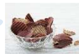
ロイスポテトチップスチョコレート