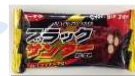
ブラックサンダー