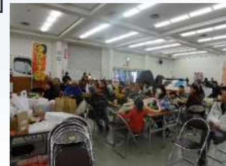
休憩コーナーでビンゴ大会