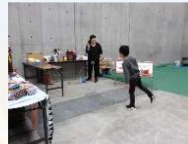
ボウリングコーナー