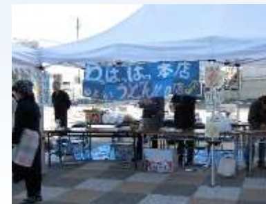
三次庄原地区支部青年部 うどんコーナー