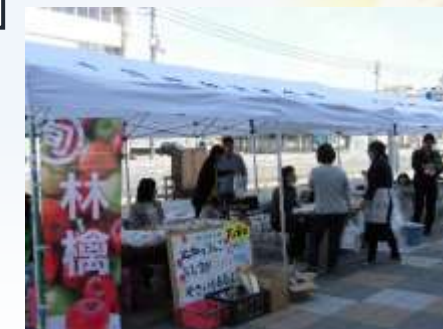
ふるさと産直販売