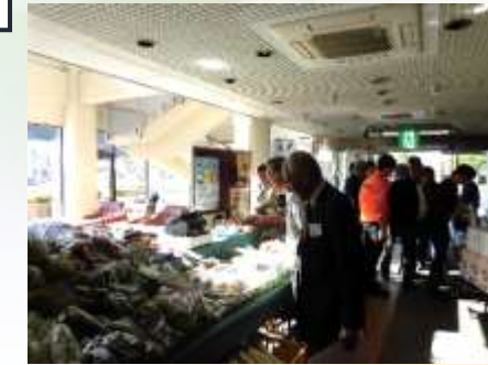
産直市場コーナー