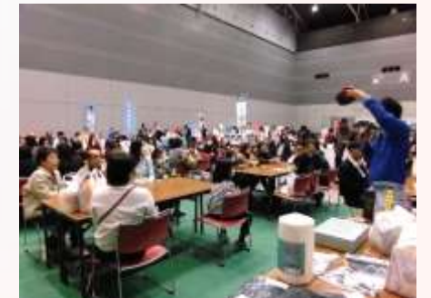
ビンゴ大会には多くの方が参加されました