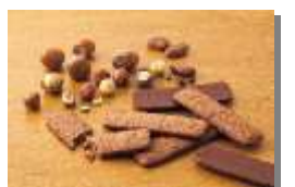
ロイスバトンクッキー(ヘーゼルカカオ)