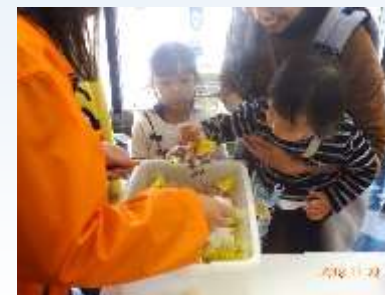
受付でお菓子のつかみ取り