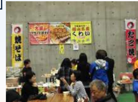
おいしい屋台コーナー