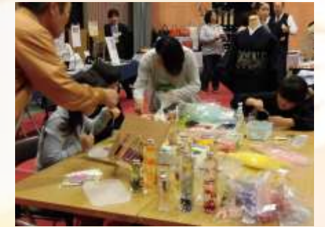
ハーバリウム体験