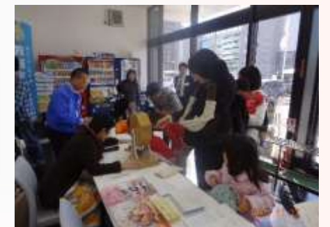
ガラガラで1等が出ればりんごが当たり!