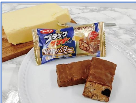
フラックサンダー至福のバター 1,080円(税込)