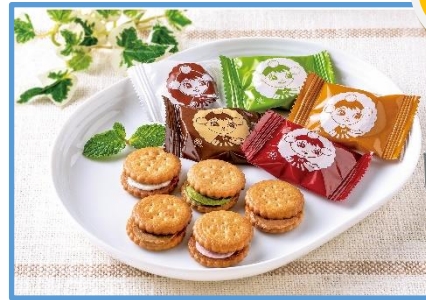
ミレーサンド 810円(税込)