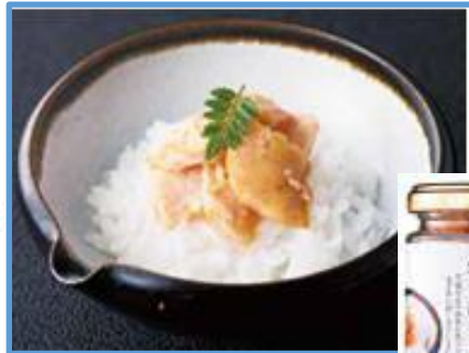
三陸産 銀鮭焼けほぐし 518円(税込)