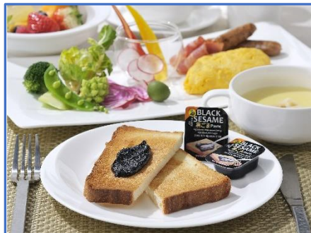
黒ゴマペーストポーション 1,296円(税込)