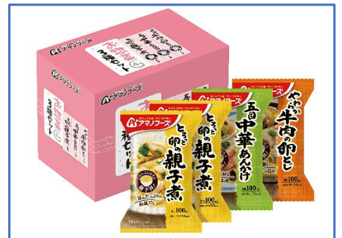
お惣菜 3種セット4食 1,134円(税込)