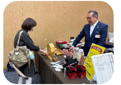
指定店のイベント ガラポン抽選会!